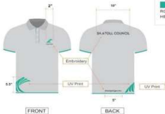
JADHUVAL 5: STAFF TSHIRT - DESIGN 1

වැරදි කිරීමේ මුදල් වැරදි කිරීමේ ස්ථානය වනුයේ වැරදි කිරීමේ මුදල් වැරදි කිරීමේ ස්ථානයයි.